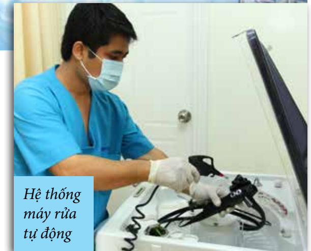
Hệ thống máy rửa tự động