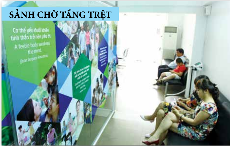
SẢNH CHỜ TẦNG TRỆT